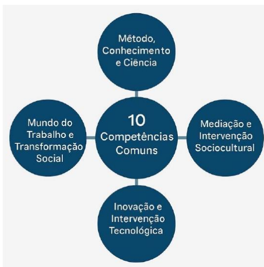
Parâmetros Nacionais - Itinerários Formativos de

Assim, para o Ensino Médio Técnico e Profissional, considerando o preposto, orienta-se a sistematização dos Eixos Estruturantes “Mundo do Trabalho e Transformação Social” e “Inovação e Intervenção Tecnológica”, organizada pela distribuição de Atribuições Empreendedoras aplicadas às nomenclaturas funcionais de Planejamento, Execução e Controle, bem como às Áreas de Ação Empreendedora de Análise e Planejamento, Ações Comportamentais e Atitudinais, Liderança, Integração Social, Criatividade e Inovação, estruturadas e em alinhamento direto com as Dez Competências Gerais dos Itinerários Formativos, como segue: